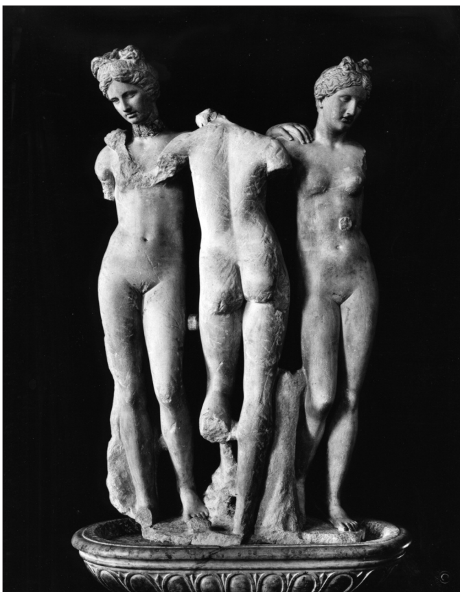
Fig. 3 – Tre Grazie , gruppo marmoreo, Siena, Duomo, Libreria Piccolomini.

Il gruppo marmoreo antico de Le Tre Grazie (fig. 3), al quale il dipinto di Raffaello si ispira, fu rinvenuto a Roma, come noto, nei terreni della famiglia Colonna presso il Quirinale e donato da Prospero Colonna a Francesco Piccolomini nipote di Papa Pio II al secolo Enea Silvio Piccolomini. Francesco tenne il gruppo nella sua casa romana fino a quando decise di trasferirlo al centro della neonata Libreria Piccolomini nel Duomo di Siena ( La Libreria Piccolomini 1998 e Colonna S. 2012). Fu in quella fortunata collocazione che Raffaello dovette conoscere il gruppo: egli infatti affiancò il Pinturicchio nella realizzazione degli affreschi delle pareti della Libreria come testimoniano anche alcuni disegni preparatori dell'urbinate recentemente studiati da Frommel (2011).