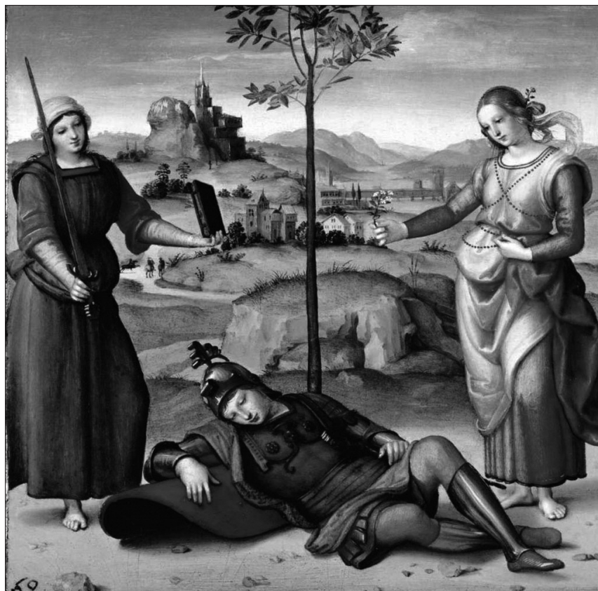
Fig. 2 – Raffaello Sanzio, Il Sogno del Cavaliere , 1504-1505 (?), olio su tavola, 17 x 17 cm., London, National Gallery.