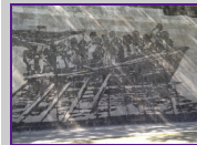
Fig. 2 William KENTRIDGE, Triumphs and Laments , 2016 Roma, sui muraglioni del Tevere tra Ponte Mazzini e Ponte Sisto