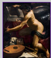
Fig. 3 Carlo Bononi, Genio delle Arti , ca. 1620, olio su tela, cm 120,5 x 101, Collezione Lauro.