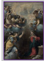
Fig. 4 Carlo Bononi, Annunciazione , 1611, olio su tela, cm 286 x 196, Gualtieri (RE), Santa Maria della Neve.

L. Lanzi, Storia pittorica dell'Italia , Venezia 1795, ed. cons. a cura di M. Capucci, Firenze