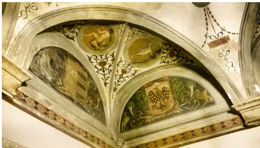
Fig. 3 - Sala dello «Zodiaco», Palazzo Orsini di Fiano Romano, 1493

L'impianto compositivo ricorda molto la sala delle Sibille affrescate negli appartamenti Borgia in Vaticano, sempre realizzate dal Pinturicchio, anche se qui a Fiano non sembra – a mio avviso – ravvisabile la mano dell'artista senese.