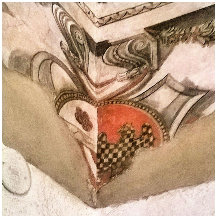
Fig. 1 - Stemma Orsini- Conti, Palazzo Orsini di Pitigliano, Sala D'armi

L'aquila su campo rosso   ben visibile in un'opera che Niccol  III commission  a Michele da Verona ed oggi conservata nella pinacoteca di Brera. Michele « firma con orgoglio» la Crocefissione 5 , lo stesso orgoglio che il generale Orsini sent  facendo immettere le sue effigi all'interno dell'opera: a destra, su una colonna,   presente lo stemma Orsini e l'uomo al centro ha uno stendardo che rappresenta un'aquila nera su campo rosso. Nella «sala d'armi» della fortezza di Pitigliano possiamo notare tutti gli elementi dell'araldica; infatti – unito allo stemma Orsini – vediamo un'aquila scaccata (nera ed oca) su fondo rosso (Fig. 1).