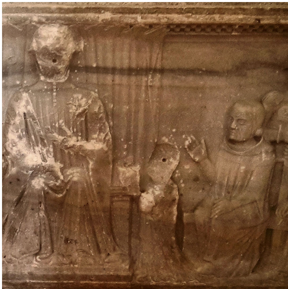
Fig. 2 - Probabile Sarcofago di Elena Conti con ritratto di Niccolò III Orsini, Chiesa di San Biagio, Nola (Napoli) part.

« Niccolò III Orsini conte di Nola e di Pitigliano volle che qui venisse sepolto il corpo della sua cara moglie Elena Conti e che per l'anima di lei si celebrasse una messa per settimana e ogni anno un uffizio funebre: per il che donò a questo convento 50 iugeri di terreno nel Piano delle Palme. Anno 1504: 8 giugno»