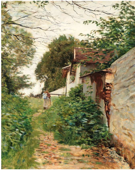
Fig. 2 – TELEMACO SIGNORINI Sul sentiero a Combs-la-Ville , 1873 olio su tavola, cm. 26,5 x 17 Collezione privata