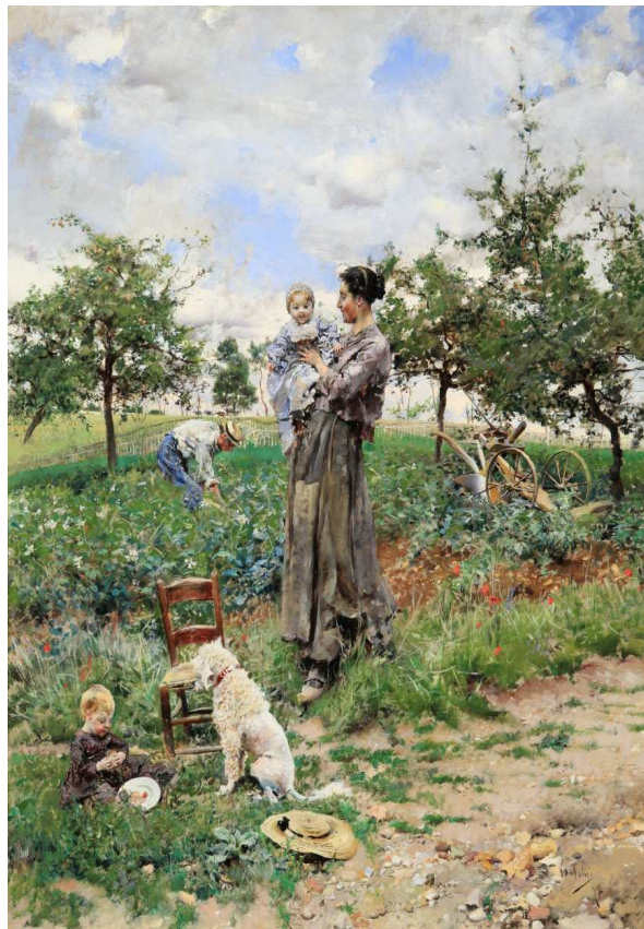
Fig. 3 – GIOVANNI BOLDINI A la campagne (La primavera) 1872, olio su tavola, cm. 67 x 54,5 Collezione privata

con i medesimi tagli di strade viste lateralmente o di fronte - di denittissima memoria - le luci perturbate, la vegetazione rigogliosa e fremente e le scenette familiari come il puntuale inserto