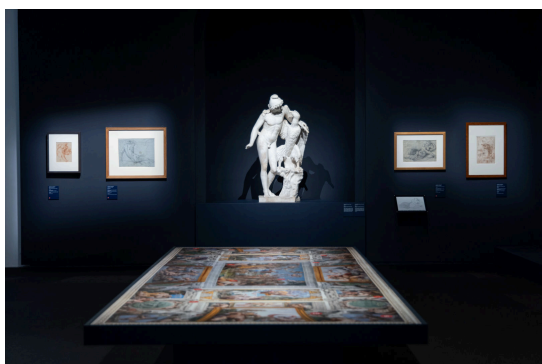
Fig. 1 - Sala di Villa Caffarelli dei Musei Capitolini dove in occasione della mostra è stato idealmente ricostruito l'ambiente della Galleria dei Carracci a Palazzo Farnese in Roma.

Nell'elaborazione del progetto è stata preferita la fase di formazione romana della collezione perché giustamente considerata dai curatori la più importante, testimoniata da alcuni prestiti dei disegni preparatori della Galleria Farnese e delle opere scultoree conservate nel Palazzo Farnese – ora sede dell'Ambasciata di Francia – realizzati da Annibale Carracci e provenienti dal Musée du Louvre , Département des Artes Graphiques da Besançon , Musée des Beaux Arts e dalla Biblioteca Nazionale Universitaria di Torino , dalla britannica Royal Collection Trust e Morgan Library di New York (Figg. 1-3)