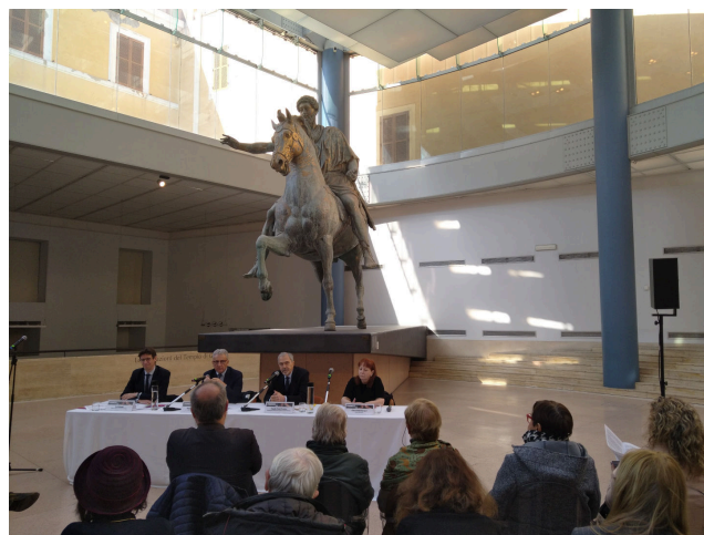
Fig. 4 – Sala di Villa Caffarelli, Musei Capitolini, Roma dove si è svolta la conferenza stampa davanti all'originale della statua equestre di Marc'Aurelio.

La conferenza stampa si è svolta davanti all'originale della Statua di Marc'Aurelio (considerato nel Medioevo come la raffigurazione di Costantino il Grande) in una posizione privilegiata piena di luce proveniente dai lucernari saggiamente a suo tempo previsti dall'architetto Carlo Aymonino (Fig. 4)