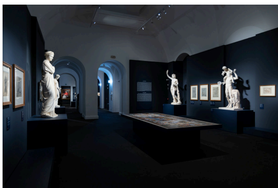
Fig. 2 - Sala di Villa Caffarelli dei Musei Capitolini dove in occasione della mostra è stato idealmente ricostruito l'ambiente della Galleria dei Carracci a Palazzo Farnese in Roma.