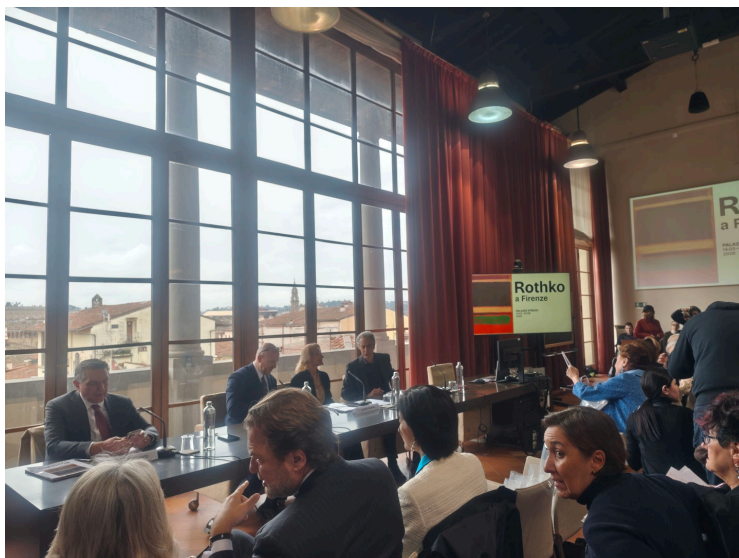
Fig. 5 - Sala stampa di Palazzo Strozzi, Firenze dove si è svolta la conferenza stampa