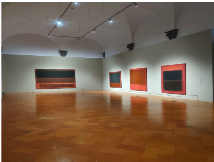
Fig. 1 - Mark Rothko, opere a partire da sinistra: Four Darks in Red , 1958, Whitney Museum of American Art, New York – Untitled , 1964, Centre Pompidou, Parigi - Untitled , 1964, Collezione Kate Rothko Prizel e Ilya Prizel, n. 765 – Light Red over Black , 1957, Tate Gallery, Londra

La sua visita alla Biblioteca Laurenziana con il monumentale Vestibolo ispirò Rothko per il celebre ciclo destinato all'esclusivo ristorante Four Season di New York mai consegnato e poi donato, in parte, alla Tate di Londra.